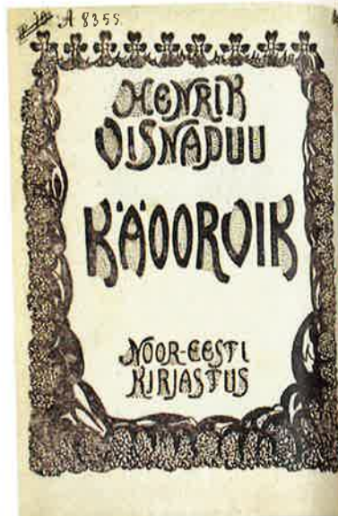
Visnapuu armastusluule kogudest on üks väljapaistvam „Käoorvik”

Kuld kollane on park, kuld kollaseid puistab lehti tuul, kuldseid liblikaid me pääle. Kuld kollane on tee, kuld kollaseid puistab lehti tuul teele. Kas nüüd kuralle, või hääle?