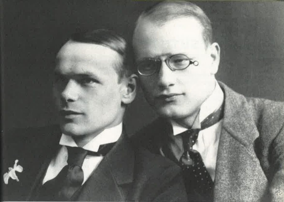
Henrik Visnapuu hea sõbra August Gailitiga