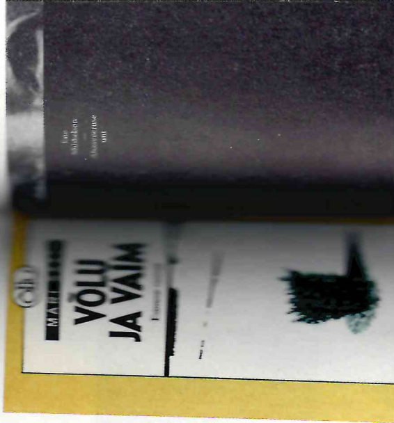
M. Saadi. „Võlu ja vaim” (1990) – raamat tütarlaps Eedu ümbritsevas maailmas sobimatusest Eedu ümbritseva maailmaga