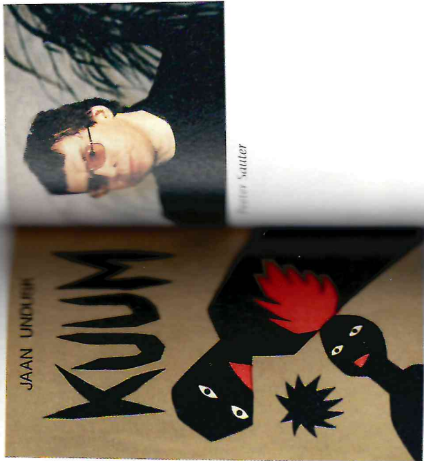
J. Unduski „Kuum” käsitleb keele ja tegelikkuse loomise vahendit

Sauteri „Indigos” kajastuv kõrgemate väärtusteta maailmapilt nõudis madalat keeletarvitust. Sauteri tekst on rõhutatult kõnekeelelähedane, ta väldib metafoore ja