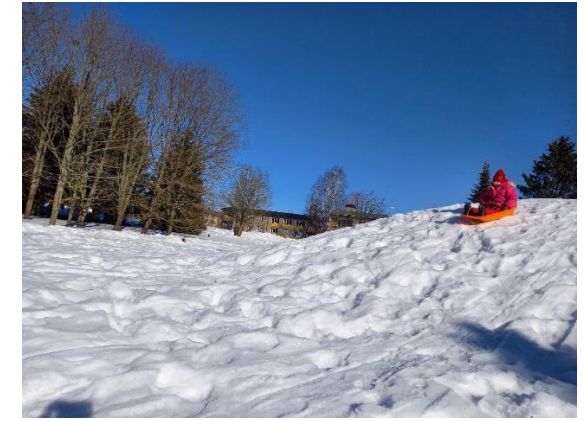
01.03: vastlapäev, juhhei!