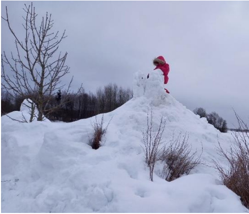
26.02: elektrikatkestus 2.päev. Niipalju õues kui võimalik.