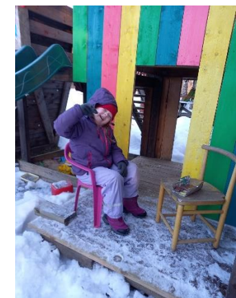
05.06: esimene piknik aastal 2022!

Tööprotsessist. Tunnistan, et päris raske oli meeles hoida, et teeksin iga päev klõpse oma päevast. Nt.02.03 oli mul päeva otsa koolipäev ning alles hilisõhtul kodus tuli pildistamine meelde ja seepärast selline valik. Ka tunnistan ausalt, et 28.02 sai pildi hiljem: ekraanivaade sai tehtud seetõttu, et praktiliselt terve päev kulus kooliasjade tegemisele. Samas 26.02 oli valikus mitu pilti, nt. ka õhtul küünlavalguses õdus istumine. Ning 04.03 oli päevas palju emotsionaalseid ja meeldejäävaid hetki, kuid fotodokumendina sai jäädvustatud vaid üks.