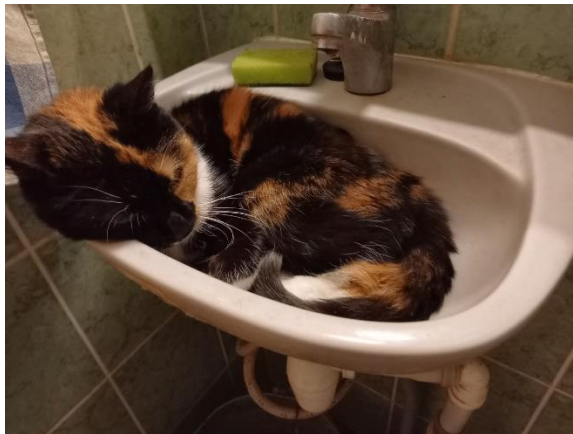
02.03: kiisu mõnuleb 😊