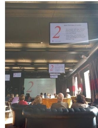
04.03: täiskasvanuhariduse konverents