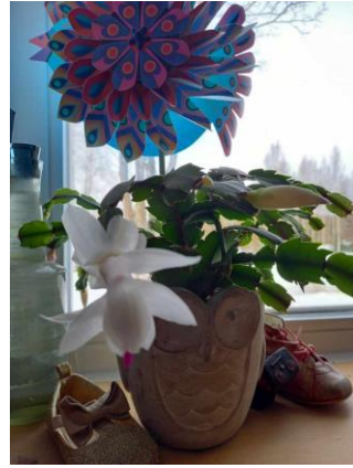
27.02: rõõm segases ja sünges argipäevas. Jõulukaktus õitseb.