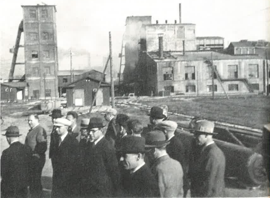
Kirjanikud 1938. aastal Virumaal

1920. aastail arenes eesti proosakirjandus kiiresti ja mitmes suunas. 1920. aastate esimesel poolel torkab silma vooluline mitmekesisus , kus kõrvuti esinesid klassikalised traditsioonid ja modernistlikud eksperimendid. Uusromantismi valitsemisaeg oli möödas, kuigi üksikuid tippe veel leidis: Friedebert Tuglas jätkas kõrgel tasemel uusromantiliste novellidega, August Gailitilt ilmus 1928. aastal romantilise