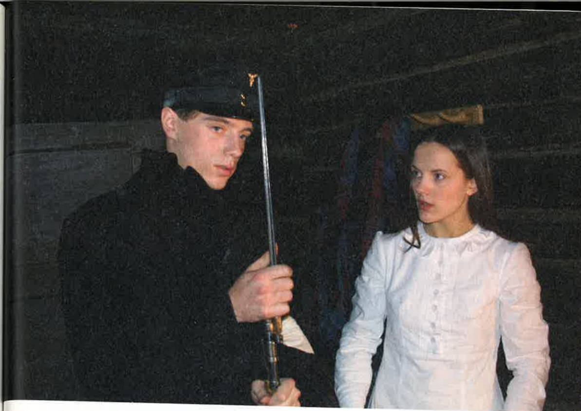
2002. aastal linastus Taska Filmil film Albert Kivika romaani „Nimed marmortahvlil” põhjal. Henn Ahas – Priit Võigemast, Marta – Hele Kõre.

Filosoofilisest allegooriast on kantud A. H. Tammsaare viimased teosed, eriti romaan „Põrgupõhja uus Vanapagan”. Psühholoogilist laadi teostes vaadeldakse samuti inimese ja ühiskonna keerulisi suhteid, näiteks Johannes Semperi romaanis „Kivi kivi pääle” ja Leo Anvelti romaanis „Eluhirm”.